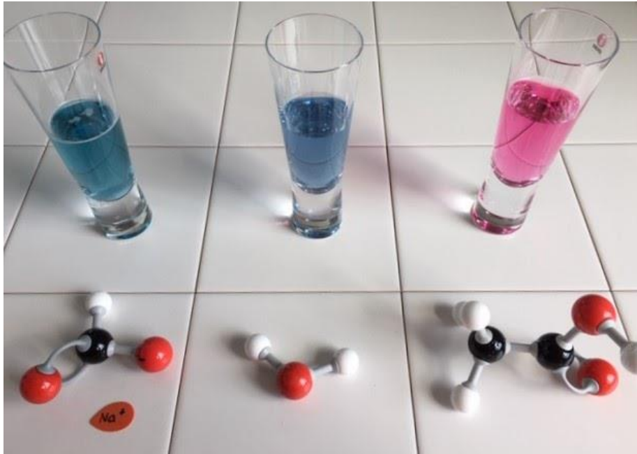
Kuva 2. Indikaattorin värit, emäksisessä, neutraalissa ja happamassa liuoksessa