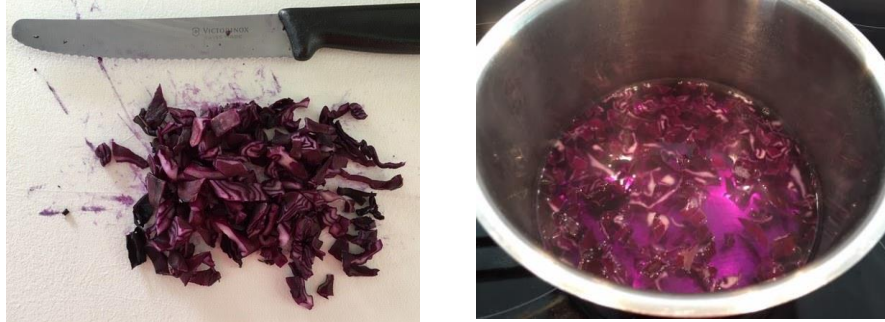
Kuva 1. Punakaali-indikaattorin valmistaminen