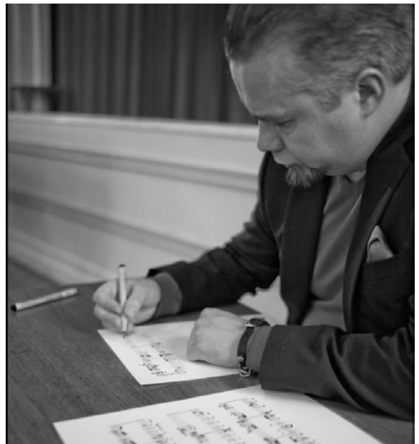
Livesäveltämistä kalligrafiakynällä Balderin salissa sävellyskonsertissani 2014.