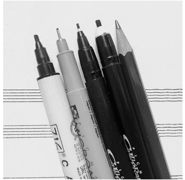
Nuotinpiirtämisessä käyttämiäni kalligrafiakyniä.

Perusnuotinnoksen kirjoitan ylös 1–2 millimetrin tasakärkisellä kalligrafiatussilla. Pienimmissä teksteissä käytän 0,2–0,5 millimetrin kärkeä. Välillä käytän viivaston kirjoittamiseen erityistä viivastoterää, Nolograph-viivastokynää tai valmiita viivastopohjia.