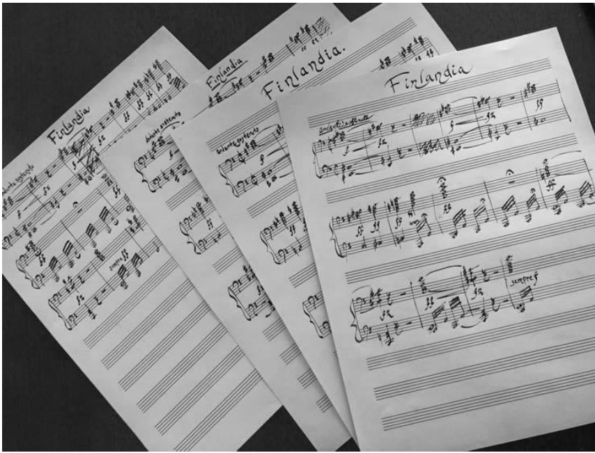
Jean Sibeliuksen nuottikäsiä jäljitteleviä kalligrafiatöitäni Pauligin mainosta varten.