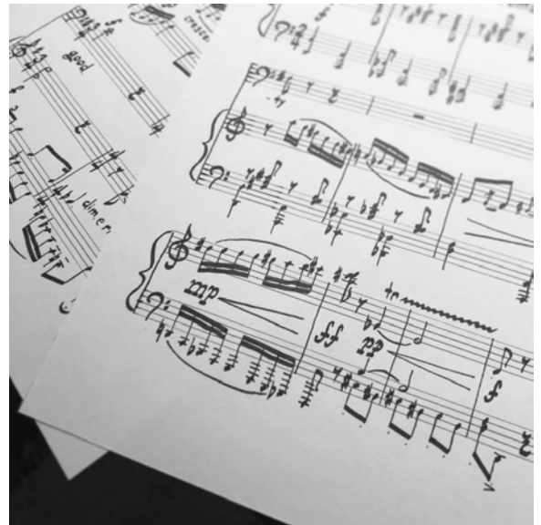
Nuottikalligrafiassani näkyy 1800–1900-lukujen painotöiden nuottigrafikan vaikutus.

Toivoisin, että musiikin käsin kirjoittamisen ja kauniin nuottikalligrafian pitkä traditio ei katkeaisi. Tämän varmistamiseksi korkeatasoista nuottikalligrafiata täytyisi opettaa uusille muusikkosukupolville.