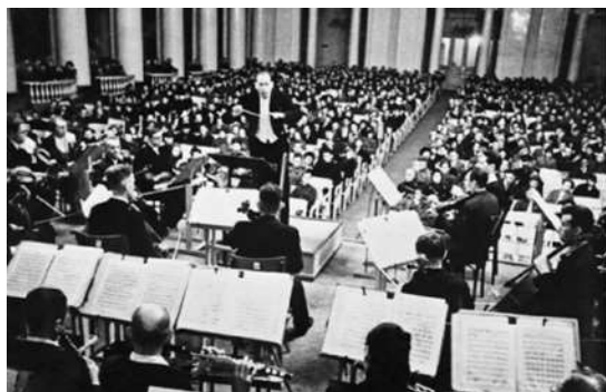
Leningrad-sinfonian ensiesitys 9.8.1942, joht. Karl Eliasberg.